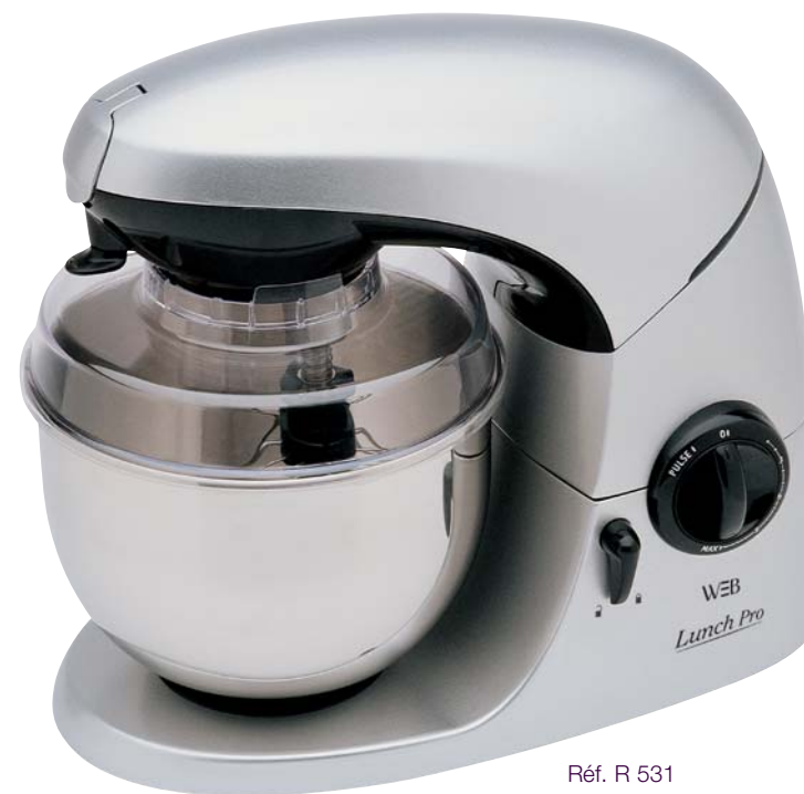
Réf. R 531